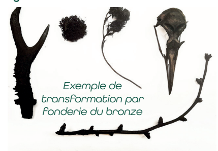
Exemple de transformation par fonderie du bronze

Informations et réservation auprès du Service Culturel de la CCMA au 02 43 30 11 11 ou via la billetterie en ligne.